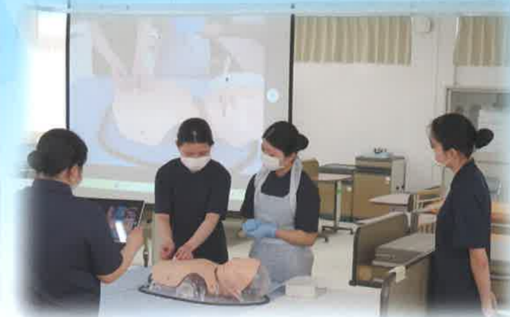
校内実習(専攻科2年生)