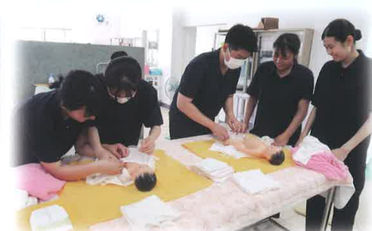
校内母性看護実習(専攻科2年生)