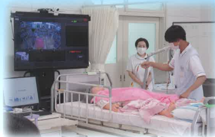
校内実習(専攻科2年生)