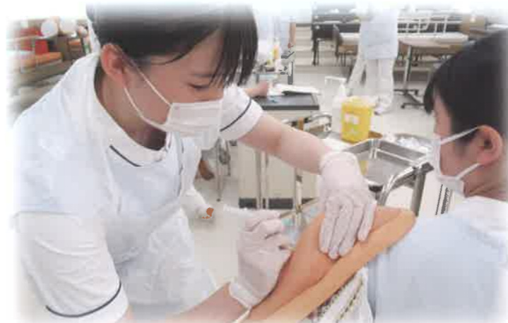
校内実習(専攻科1年生)