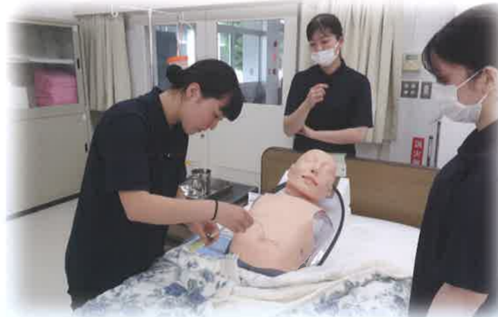
校内実習(専攻科2年生)